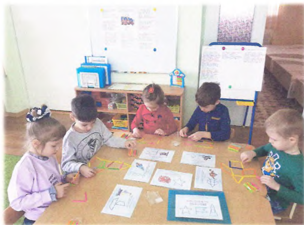
Посетили музей, выставка была посвящена освобождению Кореновска.