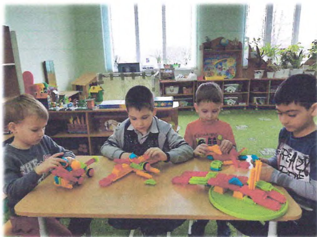
В центре математики дети складывали из палочек военную технику.