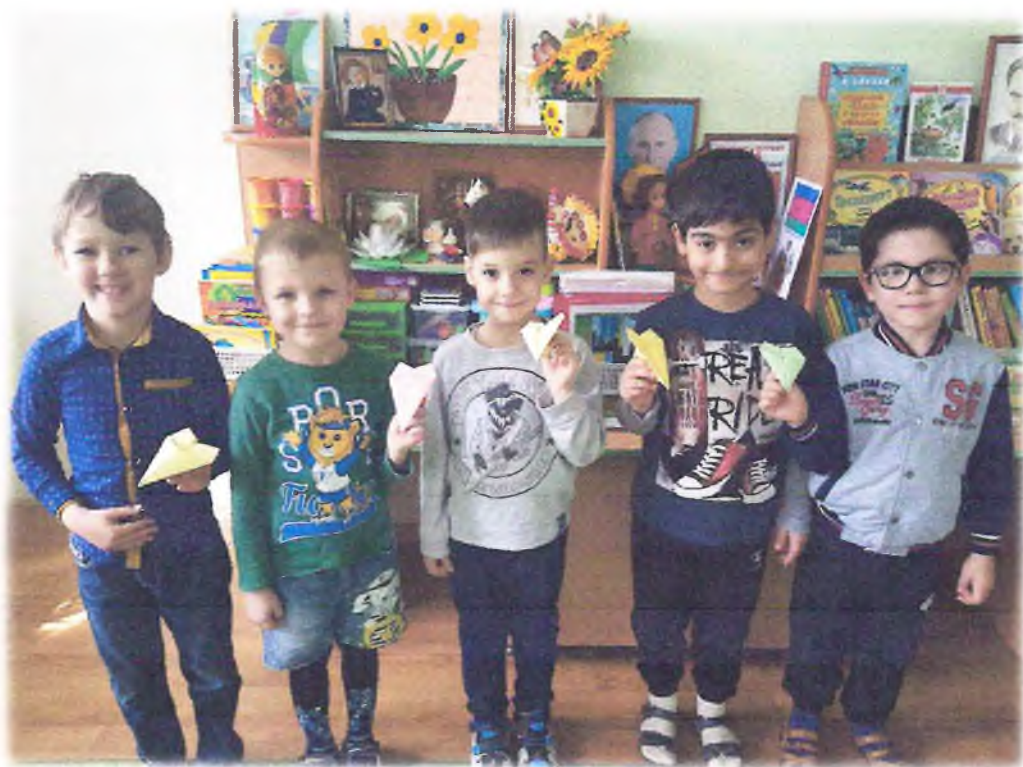
В центре кон- дулей «Ракеты