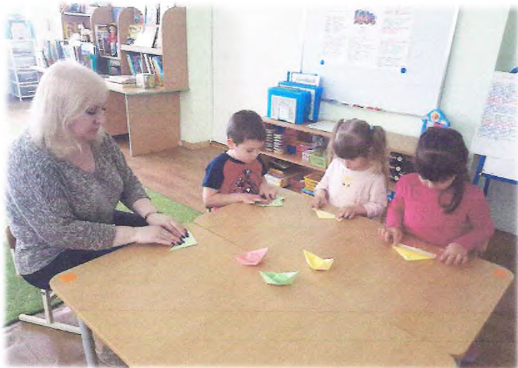
Вот, что у нас получилось