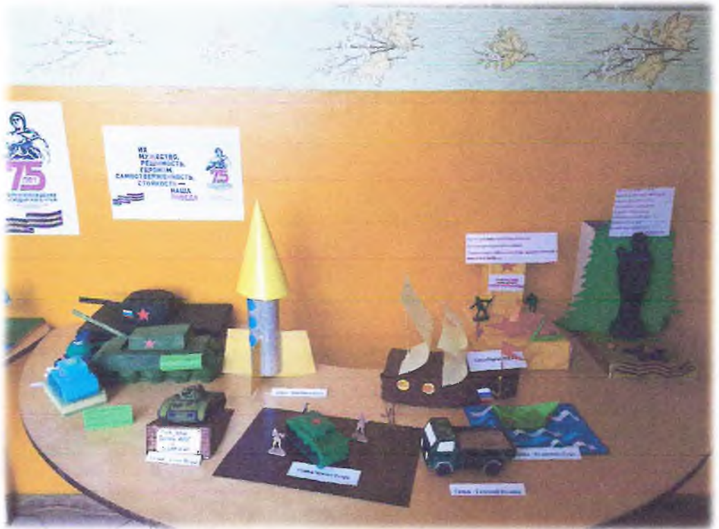
Была проведена акция «Мы за мир на всей планете», где были представлены совместные рисунки родителей и детей.