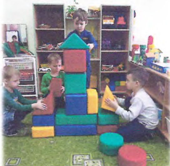
сом строили из мо- ую технику».